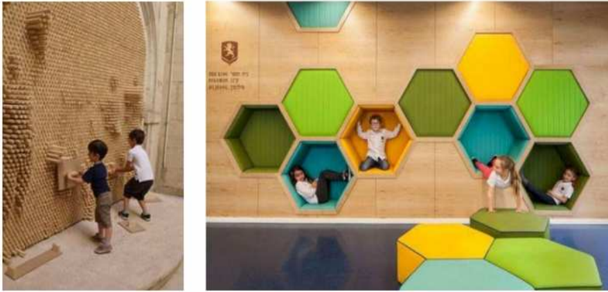
شكل (١) فكلما زادت القيمة المضافة للأعمال الفنية واصبحت ذات قيمة نفعية ووظيفية ترضي عليها جمالاً

ويعتبر الجدار هو الغلاف للفراغ المعماري فهو قد يوحي بالاحساس بالانغلاق أو الاستمرارية كما يحدد شكل الجدار ودرجة شفافيته العالقة بين الداخل والخارج، فقد استعاض مفهوم العناصر البنائية الثقيلة بالعناصر الانشائية الخفيفة والانتقال من مفهوم الصلابة والعناصر الثقيلة والتقسيم إلى مفهوم الخفة واستخدام الشفافية، فكلما زادت القيمة المضافة للأعمال الفنية واصبحت ذات قيمة نفعية ووظيفية ترضي عليها جمالاً وابداعاً آخر يثري من العمل الفني ويزيد من استمتاع المتلقي له، فأصبحت الجداريات تتحدث مع تحقيق قيمة البعد الثاني للجدار وكأنها تتحاور مع المتلقي فيصبح جزءاً من ذلك العمل الفني (1).