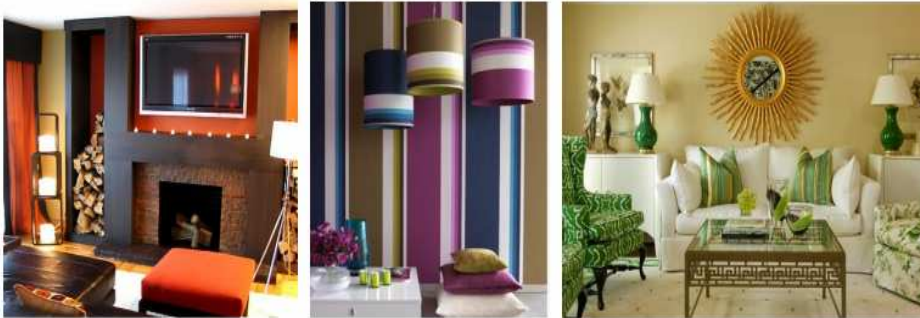
شكل (٥) منظومة الالوان في الحيز الداخلي