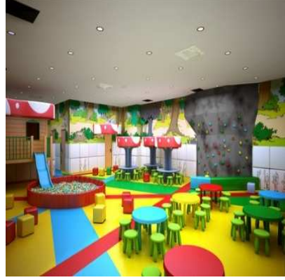
شكل (١٠) يعد الأثاث العامل الرئيسي والمهم في تصميم أو تزيين الفضاءات الداخلية

العلاقة القوية التي تجمع بين الابداع والتصميم يساهم في توسيع نطاق التفكير الابداعي في تطوير منتجات الاثاث باستخدام الخامات المتنوعة المعاصر بأشكال مختلفة ومتخصصة حسب نوع الوظيفة داخل الحيز الداخلي، الذي أدى الى الوصول ابداعات جديدة، فزاد اهتمام المصمم الداخلي بالتصميم الاثاث مما يكون له تأثير كبير على ارتياح الانسان وأصبح مرتبطا بالتكوين البصري للحيز الفضاء الداخلي عن طريق شكله ومقاييسه وألوانه.