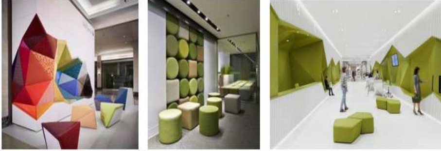
شكل (٤) تأثيرات سيكولوجية للألوان على الإنسان فإن الألوان تُؤثّر على النفس

هناك تأثيرات سيكولوجية للألوان على الإنسان فإن الألوان تُؤثّر على النفس فعندما يتم النظر إلى اللون أو الإحساس به ف يحدث في النفس إحساسات تؤدي إلى اهتزازات، بعض هذه الأفكار توحي لنا بالارتياح والطمأنينة والأخرى تؤدي إلى الاضطراب، فعند القيام بعملية تصميم لحيث داخلي ما ينظر إلى تأثيرات اللون السيكولوجية ومن بينها ما يؤثر على حجم الفضاء الداخلي الظاهري وبسبب خداع النظر وفيما يتعلق بالمسطحات والحجوم فالألوان الباردة وعلى الأخص الزرقاء الفاتحة فهي تظهر الفضاء الداخلي بأنه أكثر سعة وأكبر حجماً من حجمه الحقيقي .