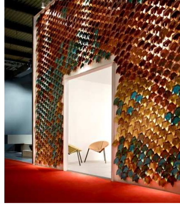
شكل (٣) يمكن استخدام خامات متنوعة على الاسطح باستخدام التفاصيل والزخارف