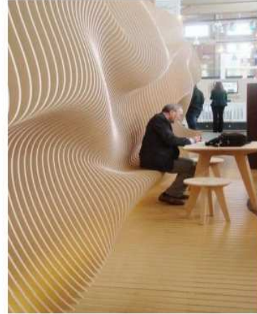
شكل (٢) الجدار هو الغلاف للفضاء المعماري فهو قد يوحي بالاحساس بالانفلاق أو الاستمرارية كما يحدد شكل الجدار