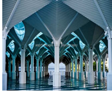
شكل(٩) تنوعت أساليب المعالجات التصميمية للفضاءات المعاصرة استناداً إلى مفهومي الوظيفة والتعبير